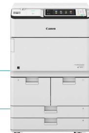
IR ADV 6555i PRT