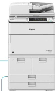
IR ADV 6575i/6565i/6555i