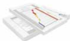
Regroupement et assemblage