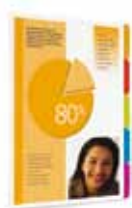
Impression avec onglets