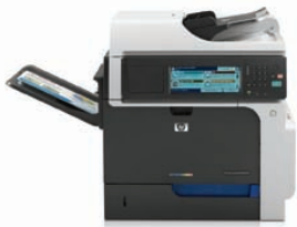
MFP HP ColorJet Enterprise CM4540