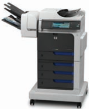
MFP HP ColorJet Enterprise CM4540fsm