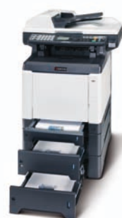
Le produit présenté comporte des options