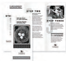
Pliage en deux, en C et en Z