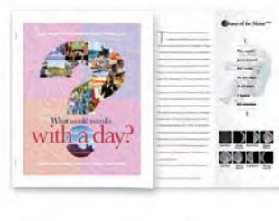
Insertion de couleur, agrafage et pliage en Z format technique