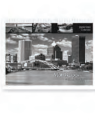
Matrice de perforation