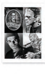
Brochure rognée SquareFold