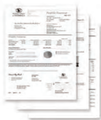
Factures et états