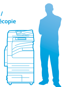
WorkCentre 5335 avec magasin en tandem grande capacité